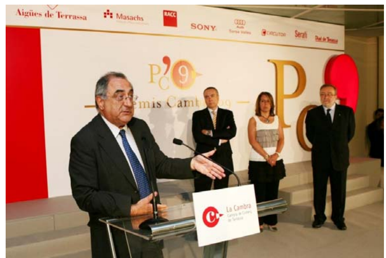
Joaquim Nadal va presidir els Premis Cambra 2009

tirar endavant en una situació desfavorable com l'actual: "Hem de fer-ho amb seny, amb col·laboració entre el món financer, l'empresarial i el polític, i trobar nous camins en un context on les coses no són fàcils" .