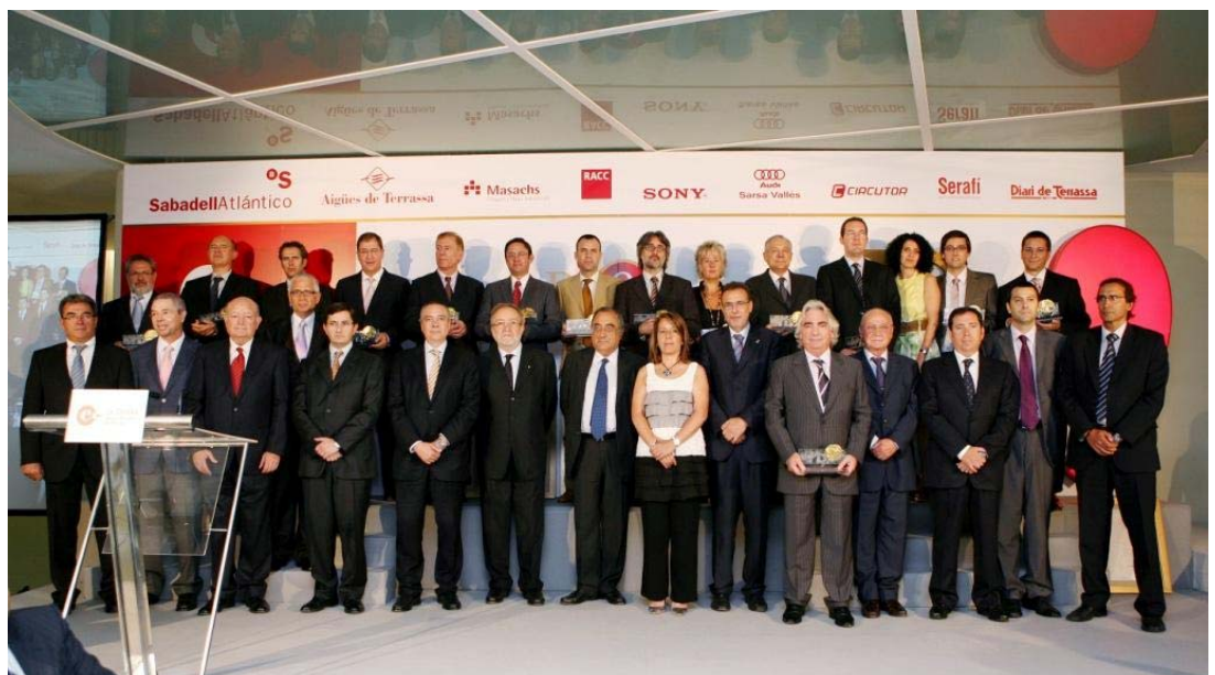
Fotografia de grup de les empreses guardonades amb les autoritats i els patrocinadors

Joaquim Nadal, conseller de Política Territorial i Obres Públiques de la Generalitat de Catalunya, va presidir el sopar de lliurament dels Premis Cambra 2009, que en aquesta edició va comptar amb més de 470 assistents, que van omplir de gom a gom la masia La Tartana. Entre el públic assistent s'hi comptaven diversos representants institucionals i empresaris de la demarcació de la Cambra, així com persones destacades del món polític i econòmic.