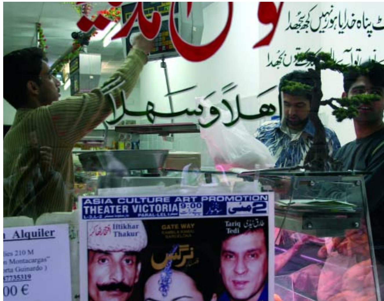
La cohesió social és l'objectiu de totes les polítiques relacionades amb el comerç