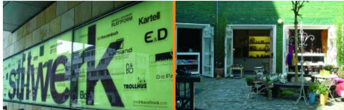
Berlín és una barreja d'història, cultura i tradició i modernitat

antics i coneguts de la ciutat, que tot i la seva antiguitat ha evolucionat i ha fet una clara aposta per l'anomenat visual merchandising , és a dir, l'exposició de producte presentat d'una manera atractiva per al client, ja sigui a la planta de parament de la llar o al supermercat. En definitiva, una aposta clara per incitar la compra en tots i cadascun dels departament d'aquests grans magatzems.