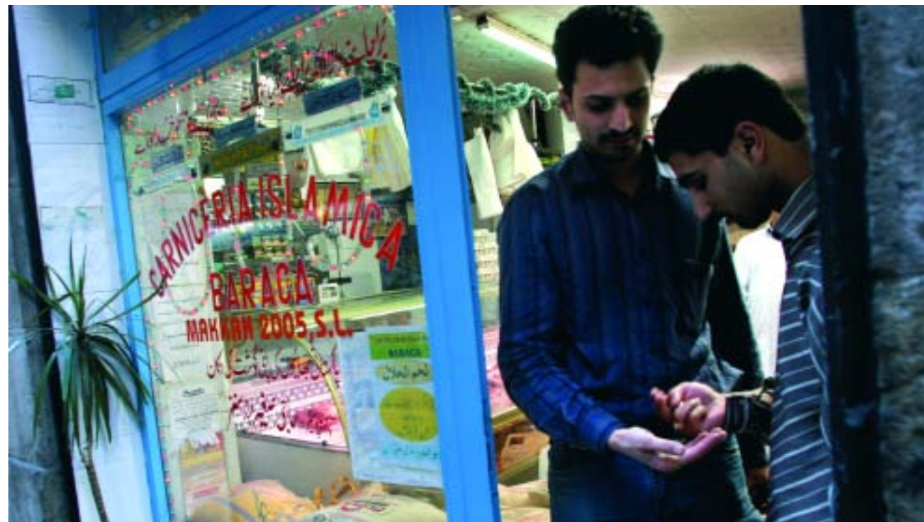
La immigració ha ajudat a transformar el comerç català

En només 10 anys, del 1996 al 2006, a Barcelona el nombre d'estrangers ha passat de l'1,6 % al 13,1 %. I és que tal com apuntava Jordi Sánchez, polític i director de la Fundació Jaume Bofill, “no hi ha referents comparables pel que fa a la intensitat i la diversitat del fenomen migratori”. La xifra d'estrangers empadronats és de 250.789 i no hi ha cap índex de desacceleració. Encara més, “les taxes d'ocupació i la creació de llocs de treball ens expliquen una part molt important del perquè del fenomen migratori”, afegeix. Així, entre el 1995 i el 2004, l'ocupació a Catalunya va créixer un 43,3 %, 932.000 llocs de treball; en aquest context, cal remarcar que el 32 % de l'ocupació durant aquest període és atribuïble a la immigració. “No és cert que el cicle migratori ha arribat a la seva fi, no és cert que hagi tocat sostre”, recordava Sánchez. Unes xifres a les quals Josep M. Marcos, gerent de l'Àrea de Logística i Distribució Comercial de l'Institut Cerdà, agregava que “en només 5 anys Espanya ha passat d'ocupar la vint-i-unena posició a l'onzena pel que fa a la proporció d'immigrants”. En aquest mateix sentit, Lluís Garcia, cap del Departament de Patrimoni de la UnescoCat va exemplificar el cas de la Ruta de la Seda com a diàleg intercultural, “ja que va contribuir a transformar les cultures posant de manifest una més que estreta relació entre la cultura i el comerç”.