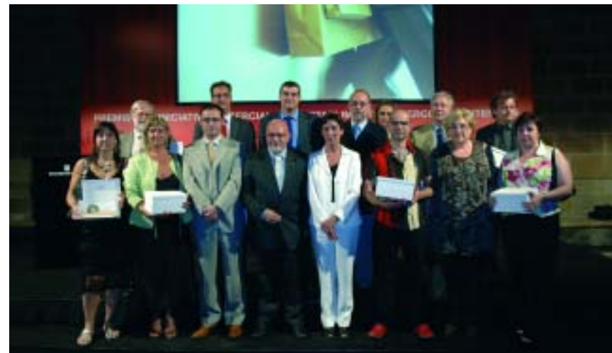
El guardonats d'enguany en els Premis de la Iniciativa Comercial acompanyats pels responsables del Departament

En la categoria de projectes d'innovació, expansió i millora de la competitivitat, desenvolupats per agrupacions de petites i mitjanes empreses o per entitats de representació d'un sector comercial, els guardonats van ser: