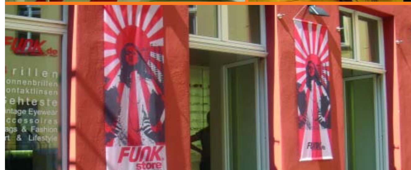
L'objectiu del retail tour és observar i veure en els petits detalls, grans i simples solucions